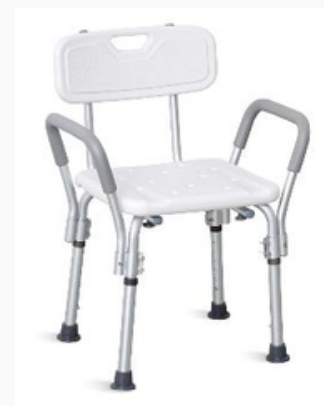
SILLA PARA DUCHA CON RESPALDO Y DESCANZABRAZOS