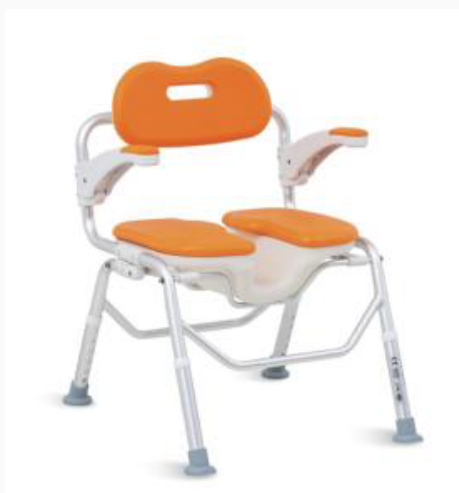
SILLA PARA DUCHA CON CAÑO DE LIMPIEZA