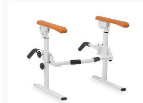
BASE PARA INODOROS