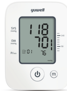
MONITOR DE PRESIÓN ARTERIAL

Portátil -Visualización de doble escala Intervalo de medición 0–40kPa (0 – 300mmHg) Valor de división mínima 0,5 kPa y 2 mmHg Tolerancia + 0,5 kPa (+ 3,75 mmHg)