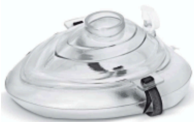
MASCARILLA RCP POCKET

Sello de pecho ventilado para el cuidado de heridas en el pecho abierto