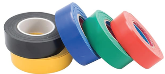
CINTAS PARA TRIAGE