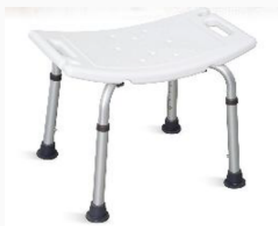
SILLA PARA BAÑO SIN RESPALDO