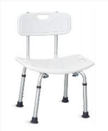
SILLA PARA BAÑO CON RESPALDO