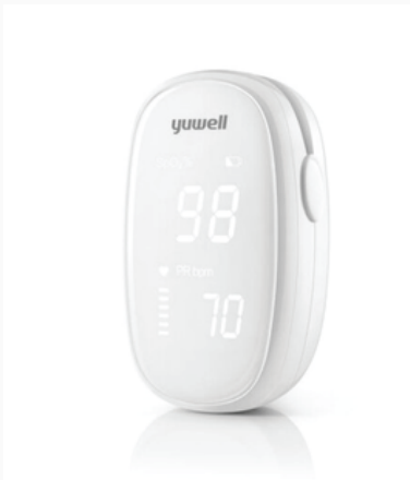
OXÍMETRO DE PULSO

Pantalla blanco y negro Modo de visualización OLED Visualización de la saturación de oxígeno 70-100% Visualización de potencia de pulso 250 BPM + 1% + 1 BPM