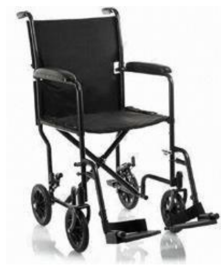
SILLAS DE TRANSPORTE

Estandar 18" De 18 " o 20" Bariátrica 22"