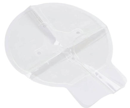
SELLO DE TÓRAX

Gasa avanzada de combate de coagulación rápida de primeros auxilios