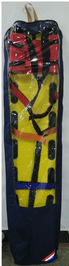
COBERTOR PARA KIT DE INMOVILIZACIÓN