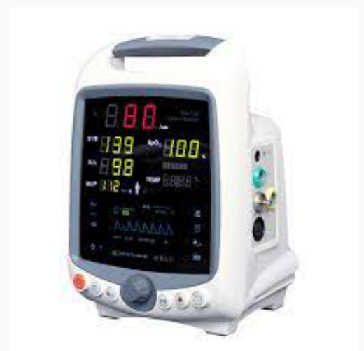
MONITOR DE SIGNOS VITALES