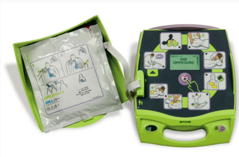
DESFIBRILADOR EXTERNO AUTOMÁTICO

COMBO 1: Glucómetro + 50 tiras reactivas regalía 50 lancetas COMBO 2: Glucómetro + 100 tiras reactivas, regalía 100 lancetas COMBO 3: 50 Tiras reactivas regalía 50 lancetas COMBO 4: 100 tiras reactivas regalía 100 lancetas