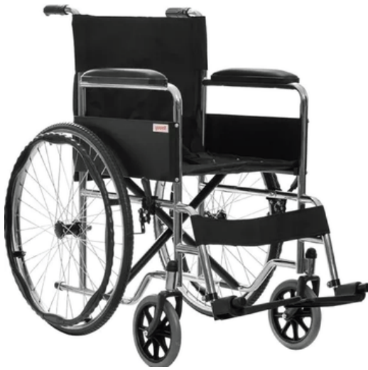
SILLAS DE RUEDAS

Estandar 18" De 18 " o 20" Bariátrica 22"