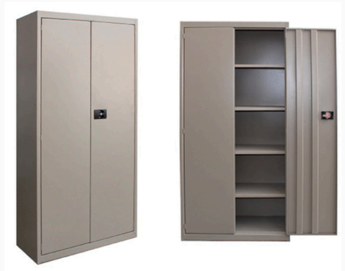
GABINETE PRIMEROS AUXILIOS