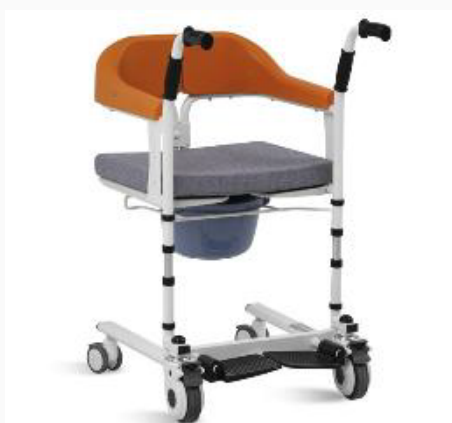
SILLA PARA BAÑO CON RUEDAS PICKUP